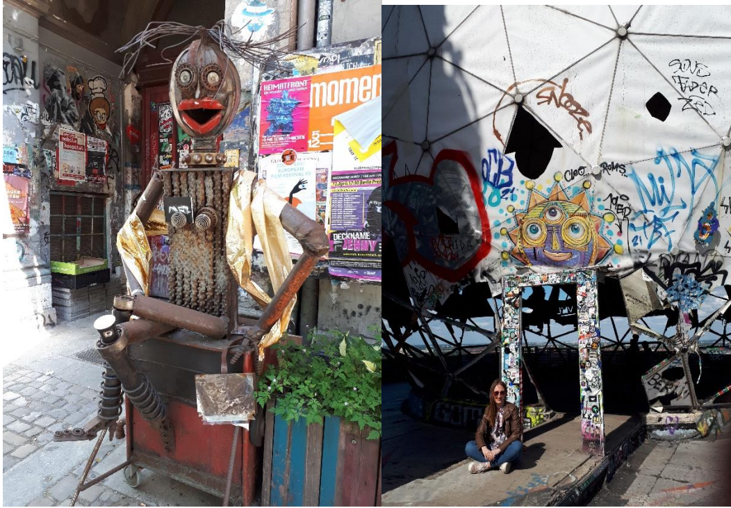
Моја омиљена скулптура, Кастаниенале Тојфелзберг, амерички шпијунски центар (рај за уличне уметнике)