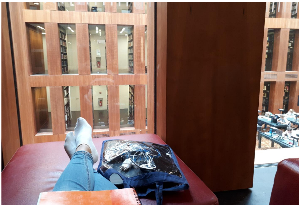
Почетна фаза моје германизације (завршне нисам фотографисала :-o)