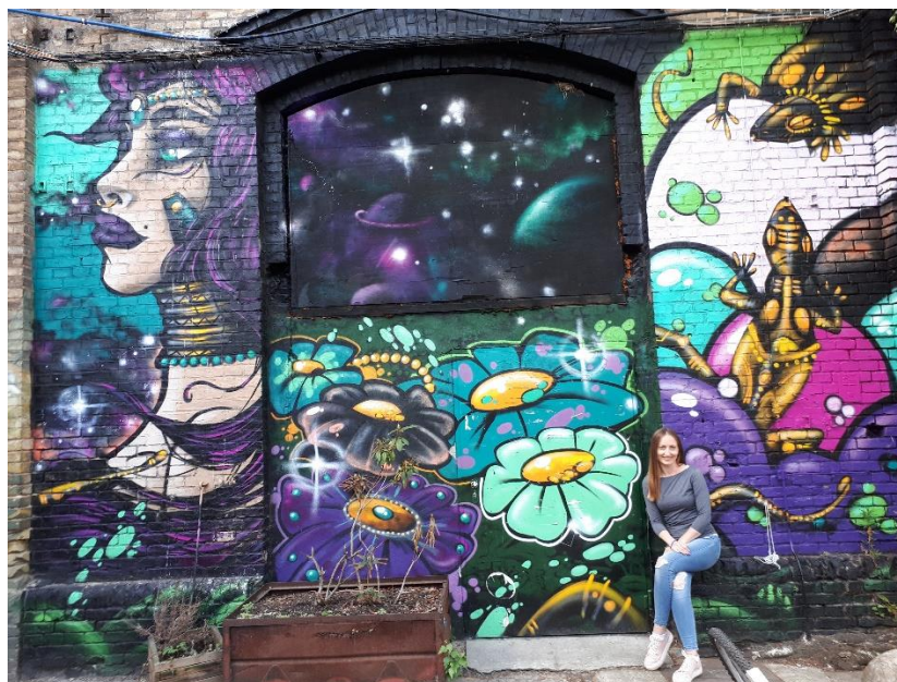
Урбан Шпрее, Фридрихсхајн