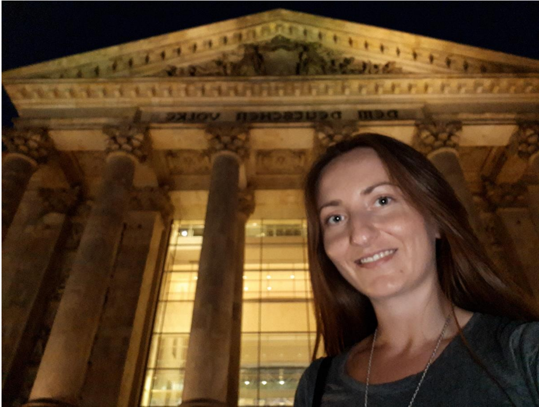
Бундестаг споља (DEM DEUTSCHEN VOLKE)