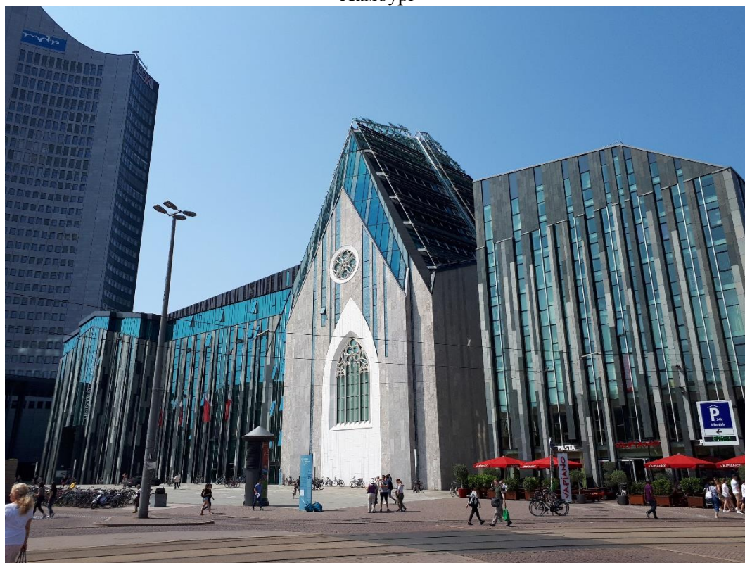
Универзитет у Лајпцигу