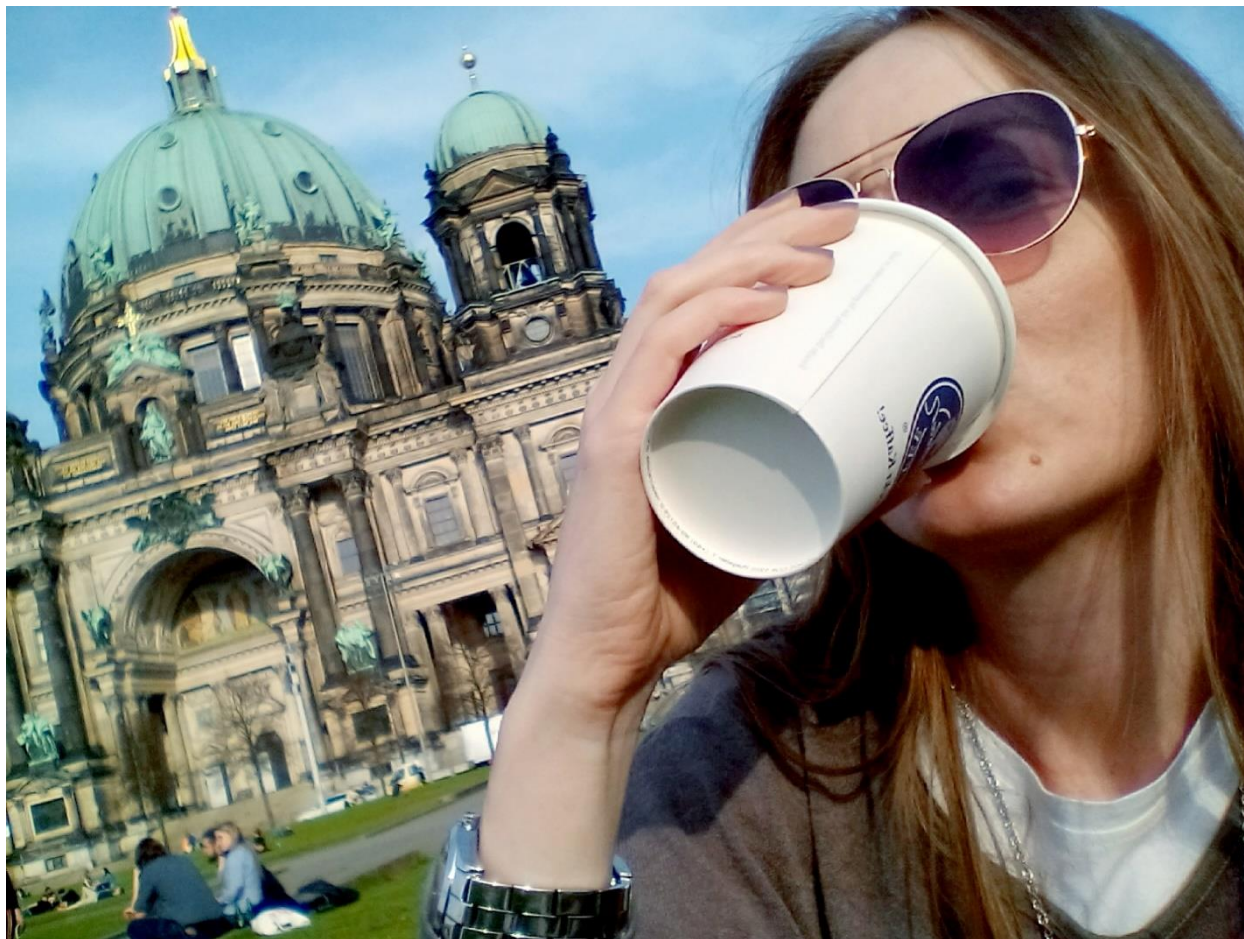
Пауза за кафу испред берлинског Дома

Вратићу се мало уназад, не бих ли споменула једини велики проблем са којим се студенти суочавају када стигну у Берлин. У питању је смештај, који је тешко наћи за пристојан новац, а често и у пристојном стању. У тој фази морате се наоружати стрпљењем и упорношћу. Тражење смештаја у Берлину направиће од вас магове за трговину некретнинама ☺.