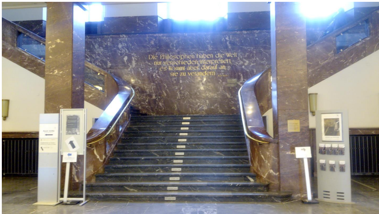
Хумболтов универзитет изнутра 2018. године

Берлин је прави студентски град са четири универзитета, међу којима Хумболтов универзитет заузима престижну позицију. Студирање и сналажење на Универзитету координишу успешно Канцеларија за међународну сарадњу и канцеларија Орбис, која интернационалним студентима свакодневно излази у сусрет, решавајући им недоумице и проблеме. Пошто сам ја на размени учествовала као студент докторских студија, те нисам имала испите, не могу вам рећи како то тачно функционише, али искуства људи које сам сретала веома су позитивна.