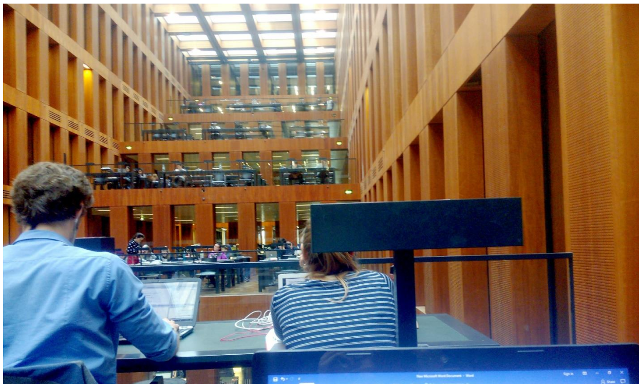
Библиотека Центра браће Грим (или у оригиналу Грим-центар)