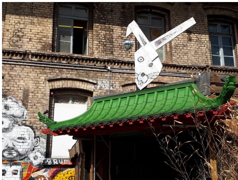
Урбан Шпрее, Фридрихсхајн