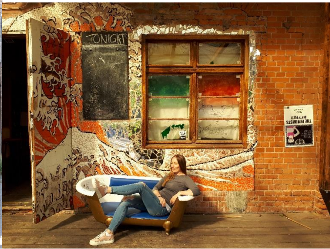
Клуб, у мом случају дневна варијанта