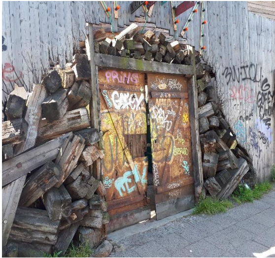
Врата од клуба

домородачке насеобине у тропским дунглама. Да чујем улицом десетине и десетине различитих језика, од којих једни зује, други лупају у таламбасе, трећи пиште, четврти звуче као континуирано гутање гласа х. Да гледам групице људи које је природа обојила у различите боје, који су одевени на безброј начина, групе које седе на трави и чији гласови из какофоније на одређеним интонацијама прелазе у благогласје. Да шетам бескрајним луксузним булеваром Курфурстендам и покушавам да објасним себи значење цена маркираних ствари у изложима, покушавајући да их претворим у неке мени познате и опипљиве вредности. Да возим бициклу око Брандербуршке капије, Парламента, по улици Унтер ден Линден, према Јеврејском меморијалу и Анхалтер Банхофу – око поноћи када нема саобраћаја и људи. Да примећујем духовите детаље у безбројним жврљотинама Берлина на зидовима, бандерама, капијама, бетонима... Да будем део једне енклаве у којој још увек успешно живе и садејствују многе различитости, у свету у ком политичка стремљења иду ка хомофобији и десници. И све то на темељима једне трагичне историје коју Берлин има.