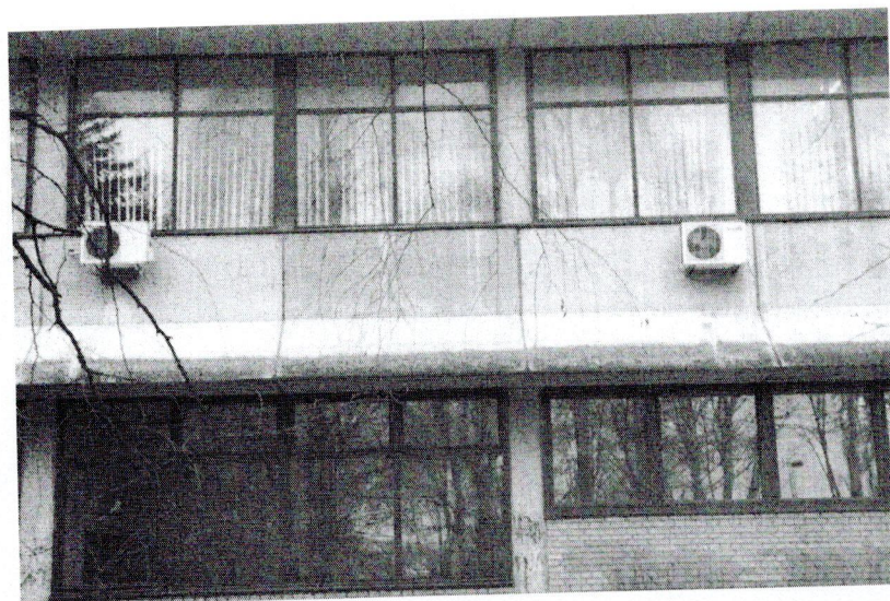
Замена фасадне браварије у приземљу зграде ФТН Чачак