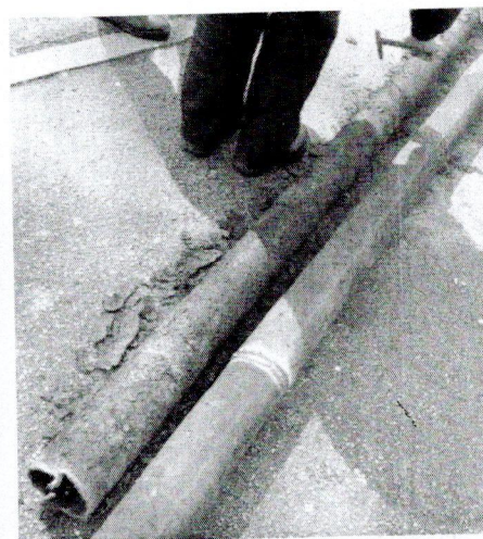
Хаварија на топловодној мрежи на улазу у зграду ФТН Чачак, март 2018. год.