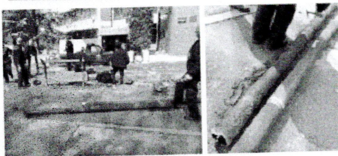
Хаварија на топловодној грејачи на улазу у зграду ФТН Чачак, март 2018. год.